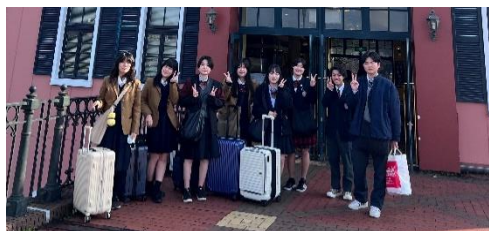
1 ハウステンボスで自由時間