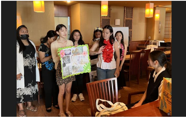
1 参加生徒による自己紹介およびプレゼンテーション