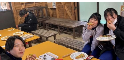
2 ピザ焼き体験(昼食)さいかい元気村