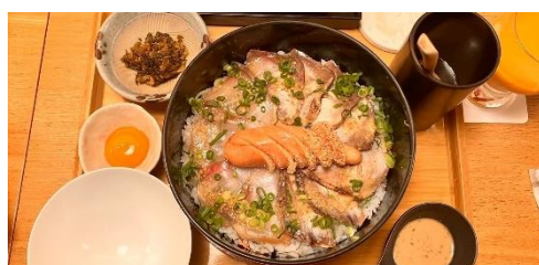
2 昼食 博多 椒房庵