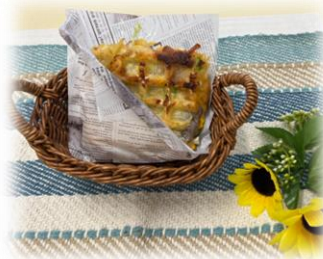
群馬のお好そば焼き