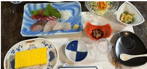
2 生産者の方々との食事会、プレゼンテーション