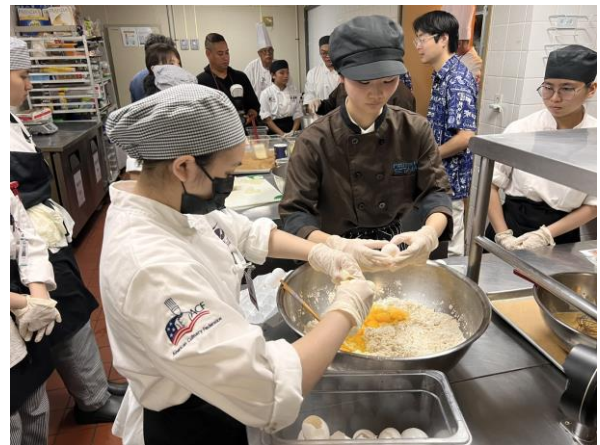
2 お互いのメニューの調理